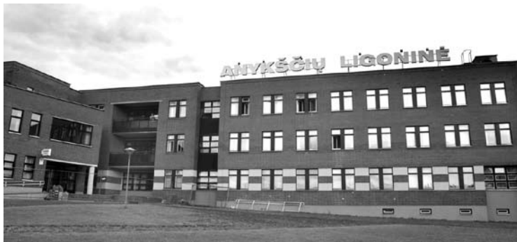
Į objektų, kuriuose bus įrengtos saulės elektrinės, sąrašą pateko ir Anykščių ligoninė.