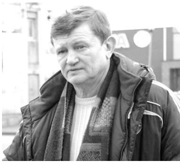
Sergejus JOVAIŠA, Seimo narys, konservatorius:

- Man apskritai yra paradoksas, kad Joninių šventė Lietuvoje yra paskelbta nedarbo diena. Ši šventė yra daugiau vakaro šventė, kurios metu ieškoma paparčio žiedo, prisimenamos kitos senosios tradicijos. Niekaip nesuprantu, kam po to dar reikalinga visa nedarbo diena.